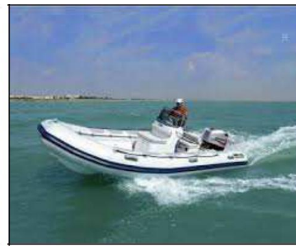
Ein- und Ausschiffung