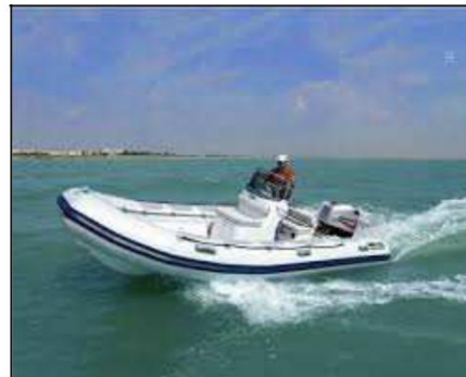
Embarquement – Débarquement